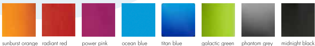
sunburst orange radiant red power pink ocean blue titan blue galactic green phantom grey midnight black